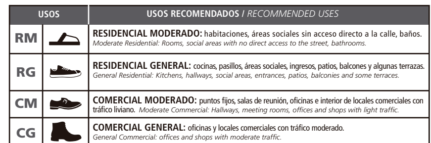
TABLA DE USOS