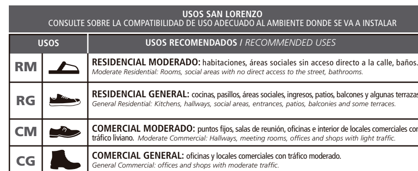
TABLA DE USOS