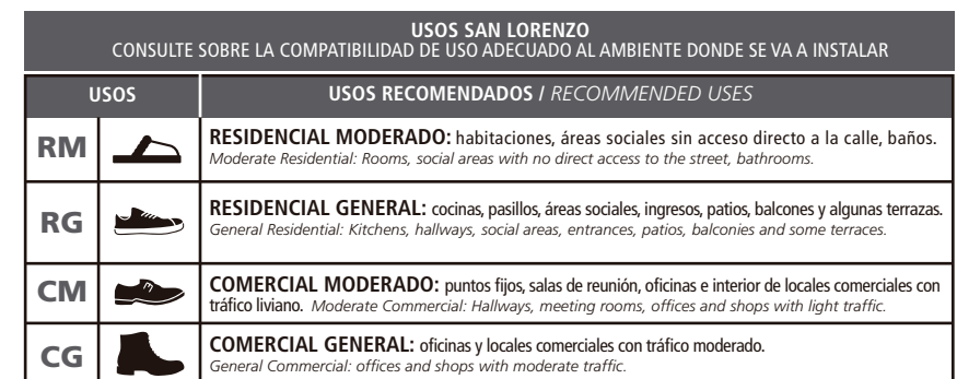
TABLA DE USOS